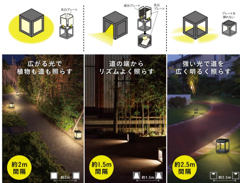
【SUNCHARGE 『道のひかり』 使用イメージ】