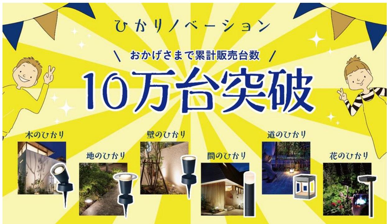
【『ひかりノベーション』シリーズ イメージ】

公式 WEB サイト： https://www.hikarenovation.com/