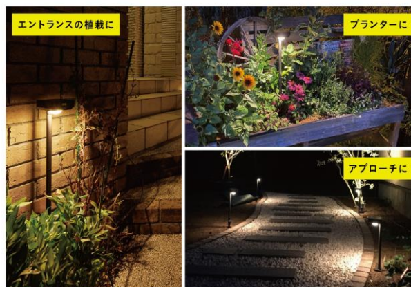
【SUNCHARGE 『花のひかり』 使用イメージ】