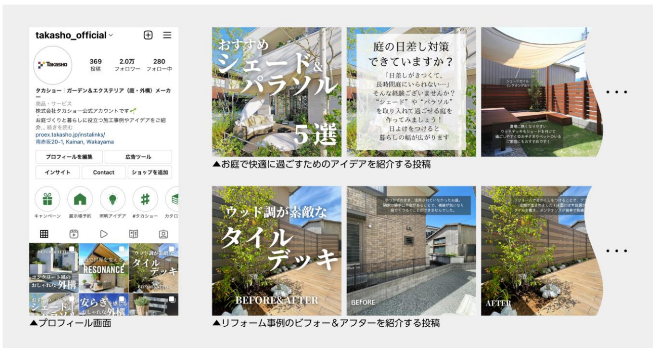
【タカショー公式 Instagram プロフィールとフィード投稿】

当社の Instagram では、豊富な施工事例写真を元にしたお庭・外構づくりのアイデアや、家の中と外をつなぐ庭空間『5th ROOM®』で楽しく快適に過ごすためのヒントを発信しております。また、年に数回イベントやキャンペーンも実施をしており、ウッドデッキや目かくしフェンスなどガーデン・エクステリア商品をお使いの方のリアルな声が集まる場としてもご注目いただいております。