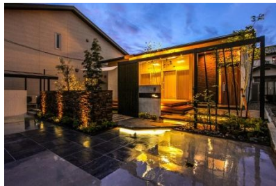
Garden B 様 (福井県) 『リビングの大きな窓からの景色と外観との バランスを考慮したデザイン』