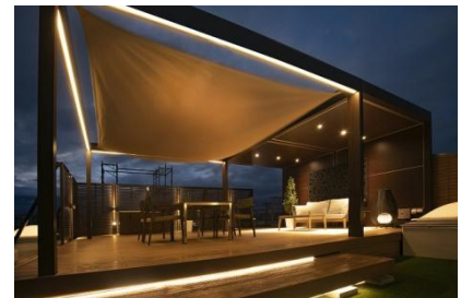
アイスタイルガーデン 様 (山形県) 『天空リゾート』