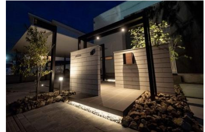
ExLEAF 様 (長野県) 『浮遊感のあるエントランス』