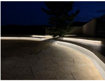
Garden studio 庭楽館 様 (兵庫県) 『ベンチに広がる幻想的な光』