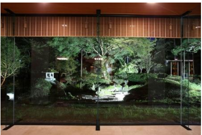
株式会社岸グリーンサービス 様 (石川県) 『おもてなしの灯りは静かに鮮やかに』