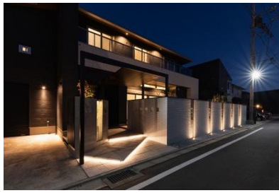
ガーデンプラス 神戸 様 (兵庫県) 『光と影をコントロールして美しさを生み出す 新築外構一式工事』