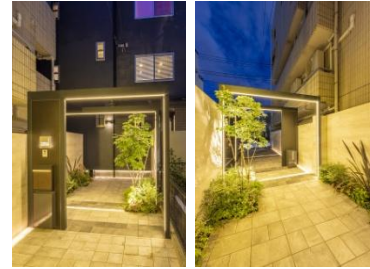
株式会社LAND-H.A.G 様 (神奈川県) 『ホテルのエントランスのようなアプローチ』