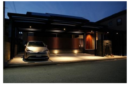
株式会社ハマホーム 様 (兵庫県) 『京の旅館をイメージした和モダンな ファサード』