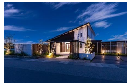
株式会社リバーフォレスト 様 (福井県) 『理想のお庭を実体験いただけます』