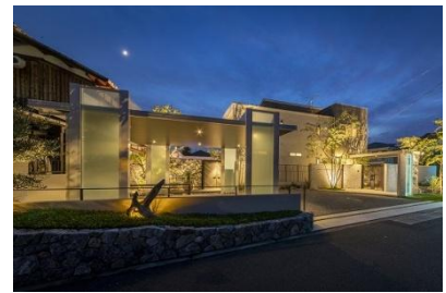
パーチェフル/GRAZIE MILLE 様 (滋賀県) 『リゾートを感じる光の演出』