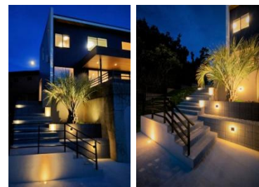
クレアカーサ 株式会社日立リアルエステートパートナーズ 様 (千葉県) 『Light the step ~空に向かって』