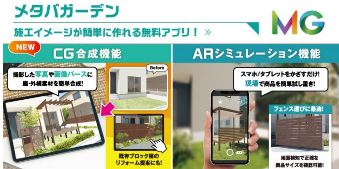
【アプリ『メタバガーデン』イメージ】

クラウド上の商品データをアプリでAR&CGシミュレーションが可能な庭・外構空間専門の無料アプリとしては、業界で初めての開発となります。アプリでは、お施主様の庭や外構空間の写真やパース画像に当社商品を指先ひとつで簡単にAR設置またはCG合成することができ、施工完了後の空間が具体的にイメージできます。