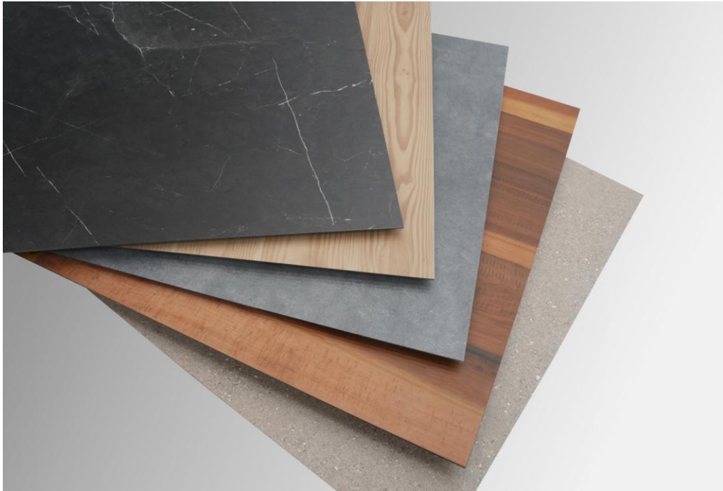
【屋内・外用化粧建材パネル「エバーアートボード シック」レゾナンスカラー イメージ】

壁面、屋根、屋内外で使用可能な耐候性に優れた化粧建材パネル「エバーアートボード シック」シリーズから、『レゾナンス』ブランドの専用カラー 8 種類を新たに開発。よりデザイン性に特化し、リアルなテクスチャーで高級感あふれるこだわりの上質な空間を演出します。