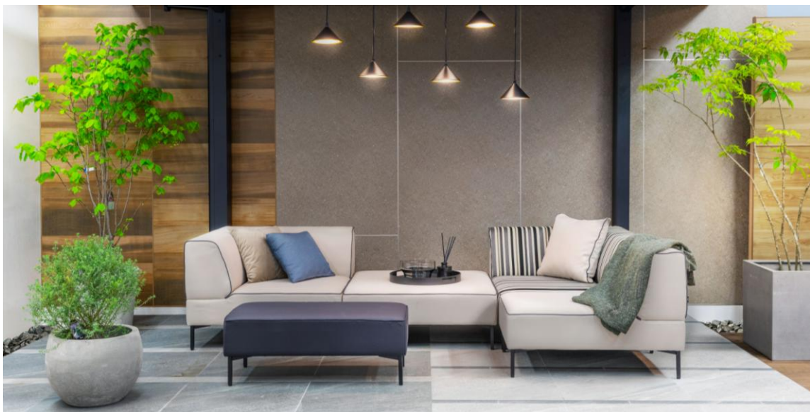
【ガーデンファニチャー「エルデシリーズ」 使用事例イメージ】

インテリアソファの座り心地をそのまま持ち出し、半屋外空間にくつろぎをプラスすることをコンセプトにデザインされた「エルデシリーズ」。奥行きを広くとることで、開放的でリラックスできる心地のよさを実現。カラーや商品を組み合わせることで、お客様のライフスタイルに合わせてご使用いただけます。