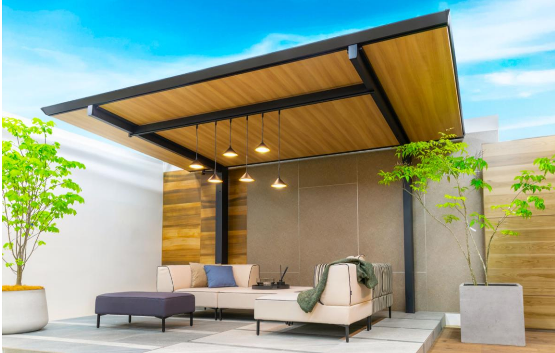
【テラス屋根「R テラス」 使用事例イメージ】

庭にもうひとつの部屋をつくる「R テラス」。無駄をそぎ落とした洗練されたフレームデザインと、木目調の美しい表情が感じられる天井屋根が合わさることで、住まいと調和するテラスが生まれます。ガーデンソファで囲んでも綺麗に収まる機能的なサイズ感を実現。オプション照明を付けることで、日中とは異なる夜の美しい情景に包まれます。