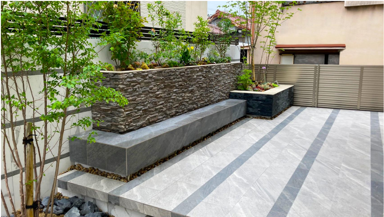
【ガーデンタイル「アヴェルサシリーズ」 使用事例イメージ】

天然石調の深みのある風合いで美しい表情が、高級感を漂わせるハイセンスなタイルシリーズです。玄関アプローチ、テラス床、壁面など、スタイルを選ばずにさまざまな空間にお使いいただけます。