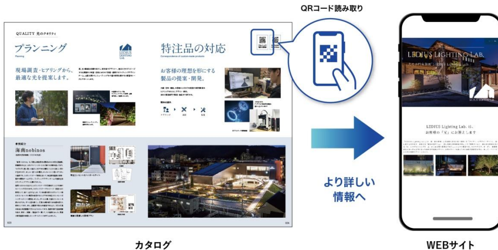
【カタログとWEBサイトの連動 イメージ】

(2) 商品スペックをより見やすく、英語ユーザーにも対応 巻末に折り返しページを設け、商品を選びながらアイコンの意味を詳しく確認できるように対応(※1)、 スペック表現を全てアイコン化し、アイコン説明を英語表記することで英語ユーザーにも分かりやすい 内容としております(※2)。 折り返しページに商品データベースへのQRコードを掲載しておりますので、商品の詳細情報を確認し いただくことができます。また、商品データベースは英語対応となっておりますので、日本語でも英 語でも商品詳細を確認いただくことが可能です。