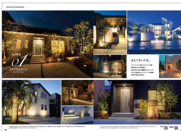
【施工例ページイメージ】