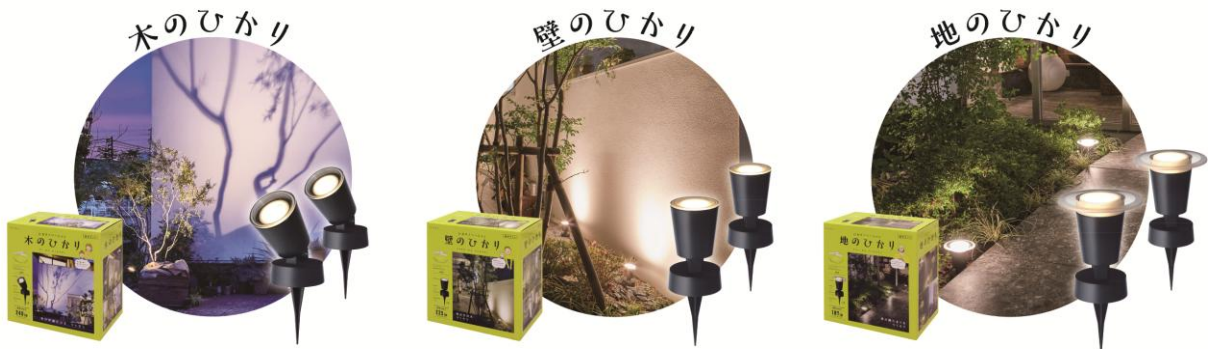
【『ひかりノバージョン』シリーズ 商品ラインアップ イメージ】

照らす目的別に「木のひかり」「壁のひかり」「地のひかり」の3種類をラインアップ。基本セットには必要な機材がすべて揃っているので、手元に届いたその日のうちにライトアップが可能です。