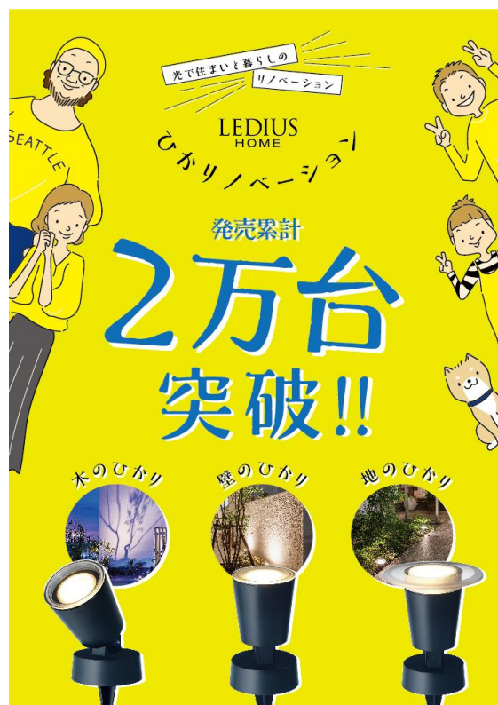
【『ひかりノバージョン』シリーズ イメージ画像】

当社では「STAY HOME」への取り組みや人々が家と庭で快適な暮らしを実現できるようなツールとして、自分で簡単にプロみたいなライトアップがDIYできる『ひかりノバージョン』シリーズを改めてご提案いたします。