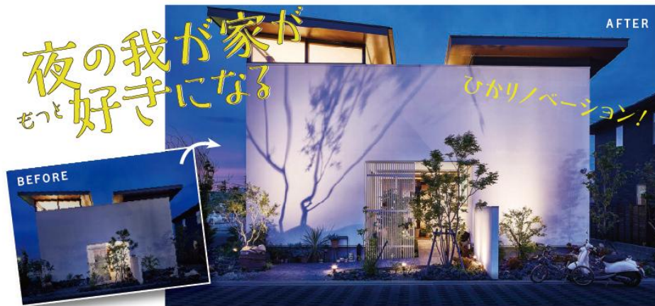
【『ひかりノバージョン』シリーズ 設置前・後イメージ】

く変化。『ひかりノバージョン』は、エクステリア向けライティングでシェアトップのタカショーが「光で住まいと暮らしのリノベーション」をテーマに、これまで蓄積してきたプロのひかりのテクニックを一般のお客様が簡単にDIYできるように展開した商品シリーズです。