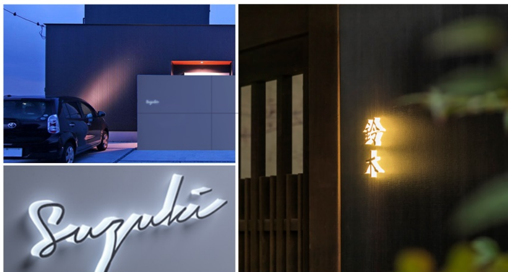
【De-sign®エバーアートボード®レター 商品イメージ】

88色のカラーバリエーションを持つ『エバーアートボード®』に光る切り文字を組み合わせた全く新しい表札で、『エバーアートボード®』や『エバーアートウッド®』とのコーディネートが可能。ボードと文字が一体化しているため、調和のとれたデザイン性の高いエントランスが創出できます。