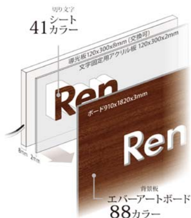
【De-sign®エバーアートボード®レター 断面イメージ】

面シートは 41 色から選べ、ボードと文字を同色にすることも、違う組合せにすることも可能。切り文字の光色は「電球色」と「白色」から選べます。