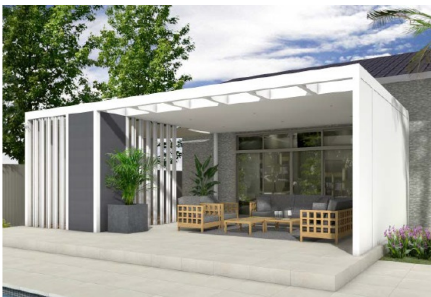
【エバーアートボード®マットホワイト マットライトグレー 使用イメージ】