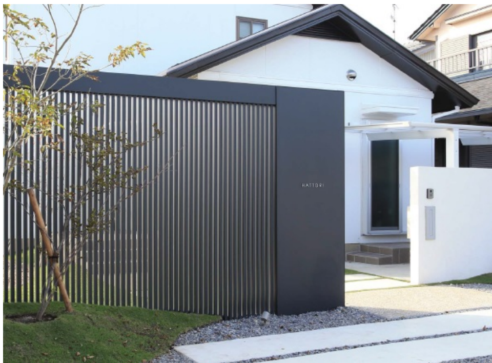
【エバーアートボード®マットブラック使用 施工事例】

多彩なカラーバリエーションをもつ『エバーアートボード®』は、従来色の80色に木目柄5色、マット系3色の計8色を加え、合計88色のカラーバリエーションとなりました。設計・デザインのカラーコーディネートや空間に合わせたデザイン、演出の幅をより広げ、多様な現場に対応します。