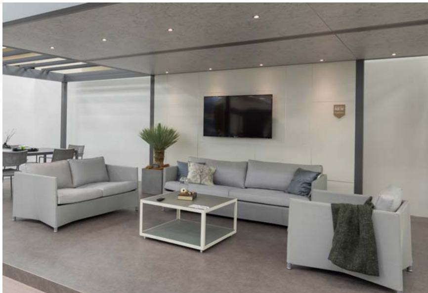
【エバーアートボード® マットホワイト 施工事例】