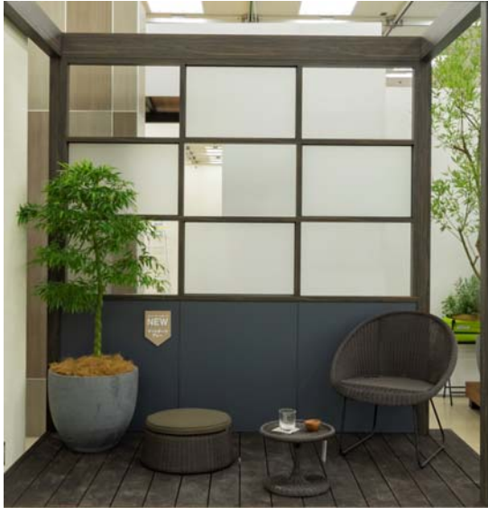
【エバーアートボード® マットダークグレー 施工事例】

( http://proex.takasho.co.jp/product/everartboard.html )