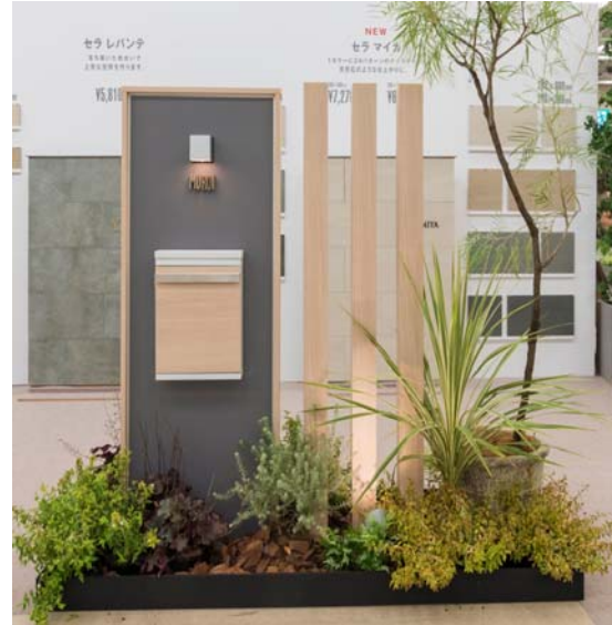
【エバーアートボード® マットライトグレー 施工事例】