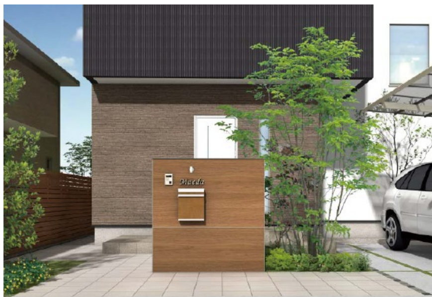
【エバーアートボード®チェリーオーク 使用イメージ】