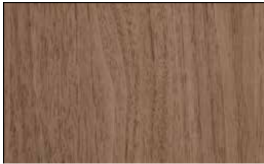
【アメリカンウォールナット】