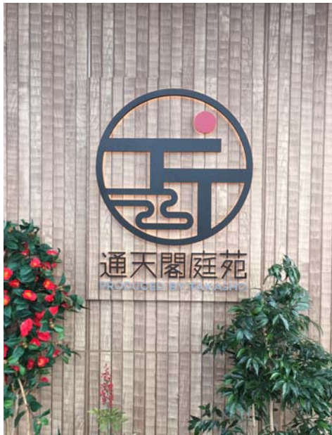
【通天閣庭苑 サイン】

また、夜のライティングには当社ライティング部門の主力商品である「LEDIUS」シリーズを使用し、LED ライトでやわらかい光にて美しい輝きと心地よい空間を演出しております。