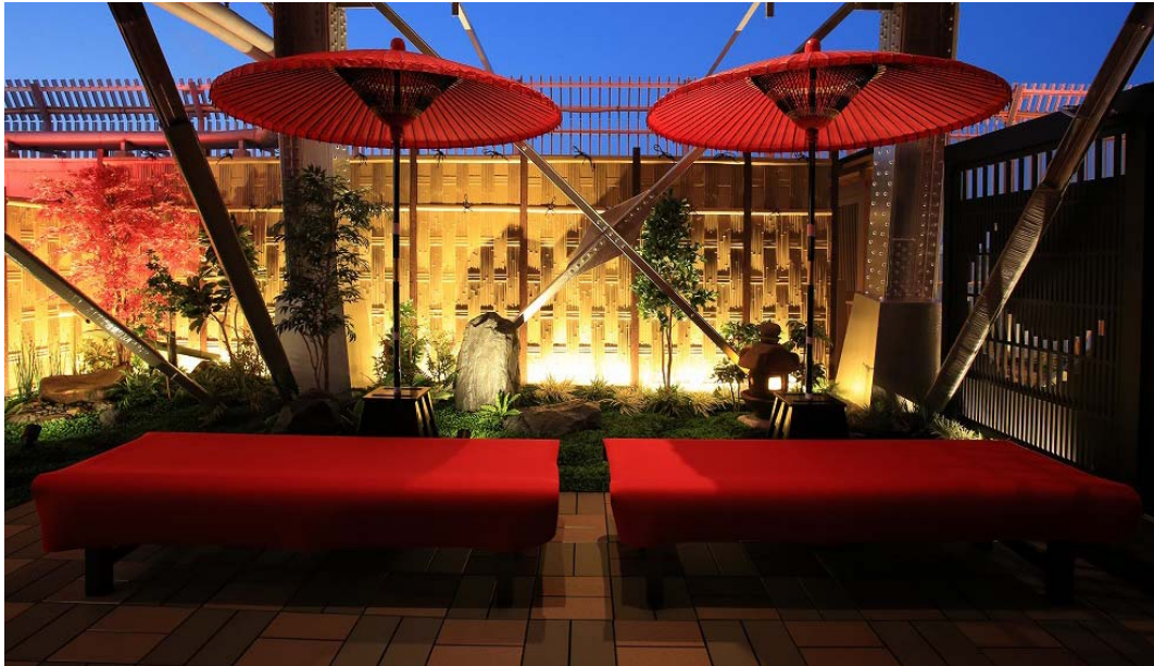
【通天閣庭苑 夜のライティング】